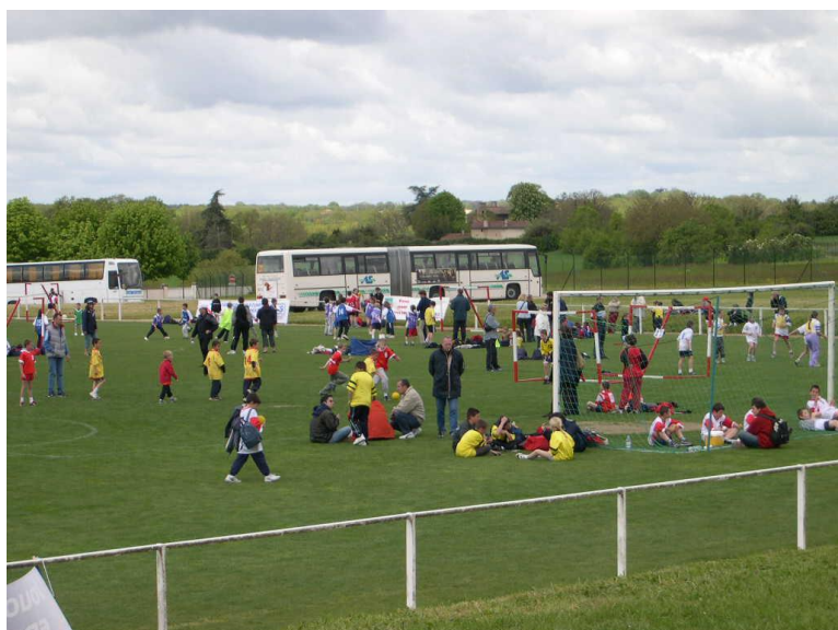
Journée Régionale des Jeunes Le 9 mai 2004 A Biard