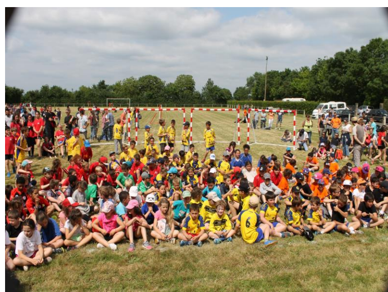
Journée Départementale des Jeunes Le 5 juin 2016 A Cram Chaban