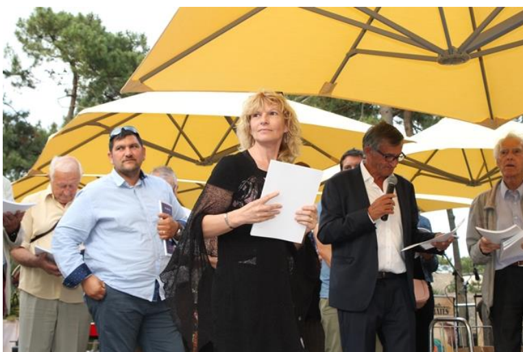
50 ans du Comité 17 Le 16 juin 2018 A Ronce Les Bains