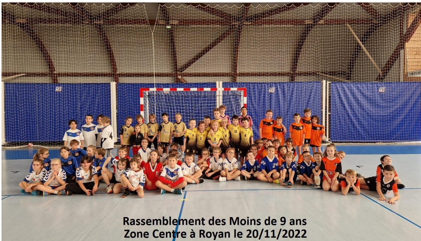
Rassemblement des Moins de 9 ans Zone Centre à Royan le 20/11/2022