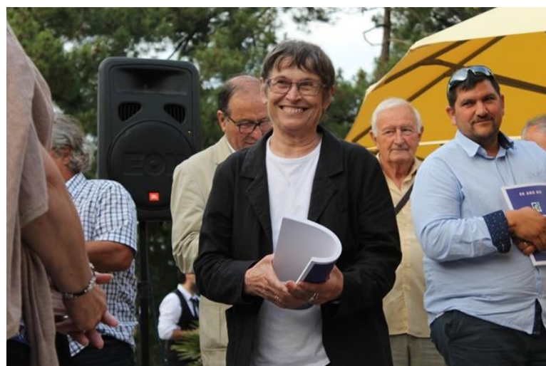
50 ans du Comité 17 Le 16 juin 2018 A Ronce Les Bains