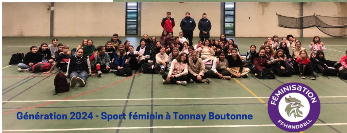
Génération 2024 - Sport féminin à Tonnay Boutonne