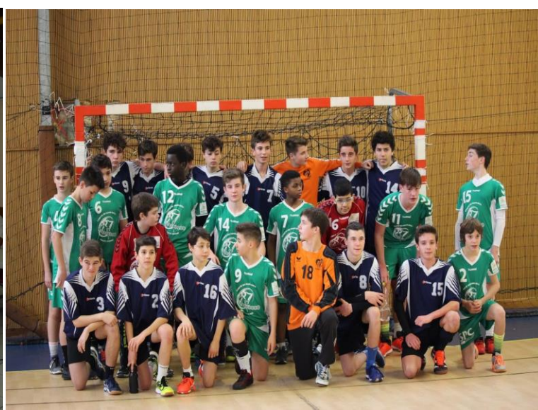
Inter Comités Le 13 janvier 2018 A St Pierre de Chignac (24)