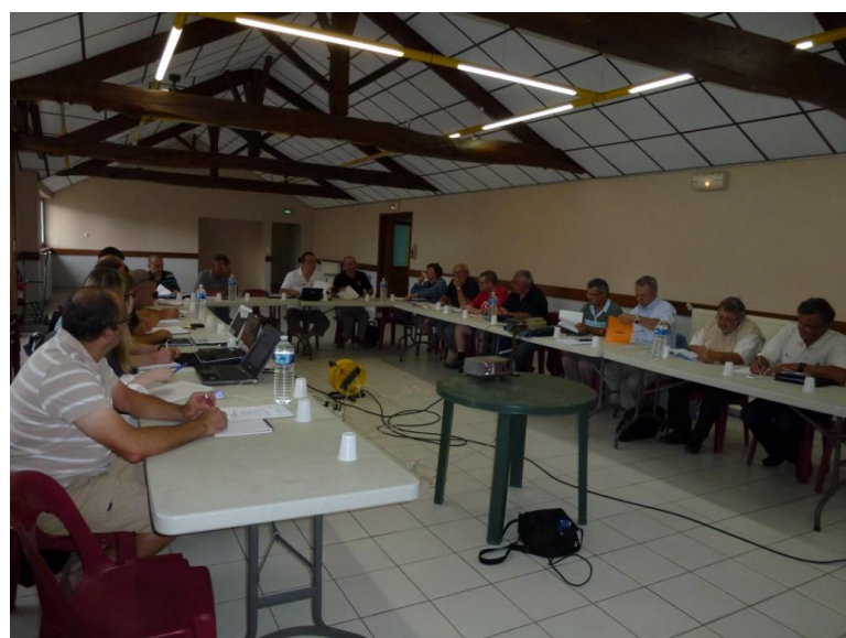
CA LIGUE Le 10 juillet 2012 A Prahecq