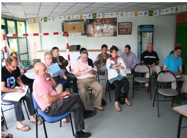
CA du CD 17 Le 28 juin 2013 A Saintes