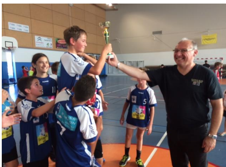
Coupe 17 des Moins de 13 ans Le 22 septembre 2018 A Oléron