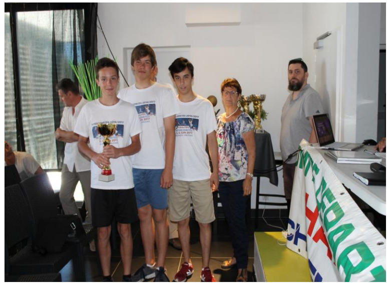
AG du CD 17 Le 17 juin 2017 A Ronce Les Bains