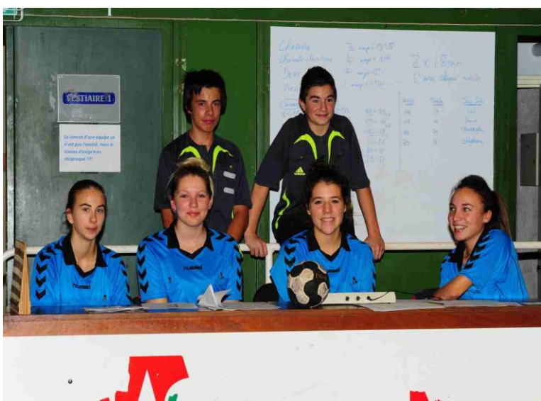
Inter-Comités Féminins Le 11 novembre 2011 A Angoulême